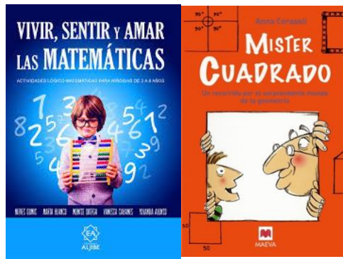
Afbeelding: Wiskunde en Meetkunde boeken (in het Spaans) met (witte) jongens en mannen op de cover. Kun je je nog andere voorbeelden herinneren zoals deze die je tijdens je studies hebt gezien?

-Stereotypen in de mediaportretten van STEAM-personages sturen de intrinsiek negatieve boodschap dat STEAM-beroepen typisch voor blanke mannen zijn. Een onderzoek van de best beoordeelde televisie/kabelshows, films, streaming platforms uit Amerika (2007-2017) toont aan dat van alle STEAM-personages die geanalyseerd werden, de meeste mannen waren. Bijna twee-tegen-één was de verhouding: 62,9% mannelijke STEAM-personages tegenover 37,1% vrouwelijke. Ook de overgrote meerderheid van STEAM-karakters in entertainment waren Wit (71,2%), terwijl een minderheid Zwart (16,7%), Aziatisch / Aziatisch-Amerikaans (5,6%), Latino (3,9%) was of uit het Midden-Oosten (1,7%) 8 kwam. Deze berichten zorgen voor een vertekend beeld van wie een wiskundige of wetenschapper is of wie de capaciteit heeft om dit te kunnen worden.