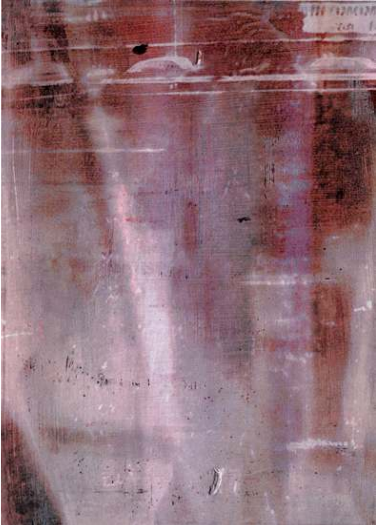
L'image Etrange © Faryda Moumouh 2017 lamdaprints 75x50cm