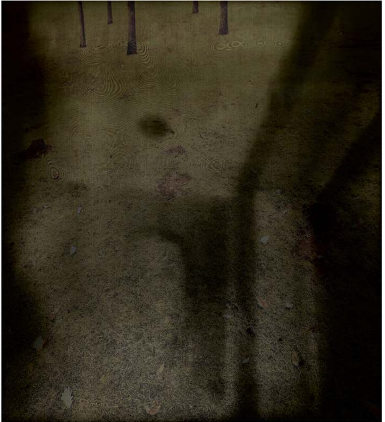
Inconnu 2019 © Faryda Moumouh Lamdaprints 60X60cm